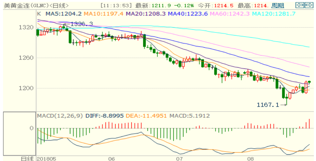
图 1：COMEX 黄金主力合约技术分析

COMEX 黄金上周反弹后小幅回落，但上周五鲍威尔发表鸽派言论令金银大涨。技术指标偏多，预计本周国际黄金或震荡上涨，人民币汇率具有稳定器作用，预计将缩小国内涨幅。