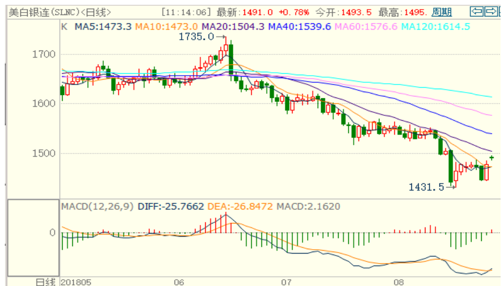
图 2：COMEX 白银主力合约技术分析